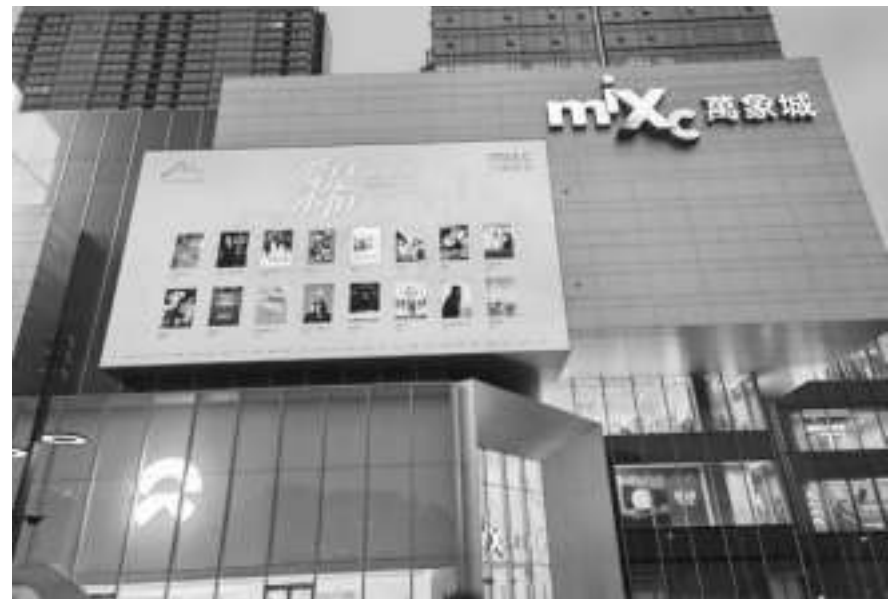
参展影院结合自身优势在地宣传

全国艺联承担片源引进、4K修复拷贝配送、全国全域宣发、标准化物料制作等全链条统筹工作,依托成熟运营体系持续优化流程,大幅降低单家影院独立策展的资金、时间、审批成本。官方公众号、短视频、小红书等全媒体矩阵同步造势,延续系列影展统