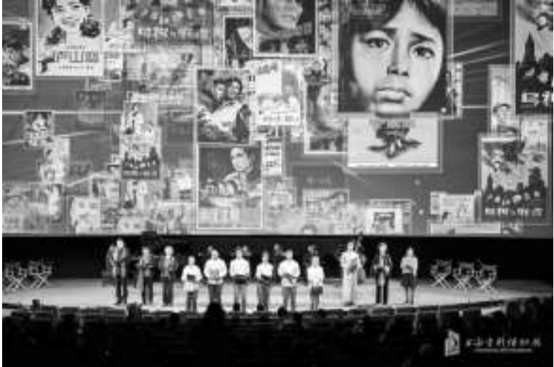
“上影来信——纪念中国电影诞生120周年影展”活动现场

上,中国电影既承载着厚重的历史荣光,也面临着全新的时代机遇。未来,电影工作者们坚守为人民服务、为社会主义服务的初心,扎根文化根脉、坚持创新驱动,深化改革赋能、拓展国际视野,创作出更多兼具思想性、艺术性、观赏性的精品力作,让中国电影在世界影坛占据更重要的位置,在建设文化强国的征程上书写更加璀璨的光影华章。