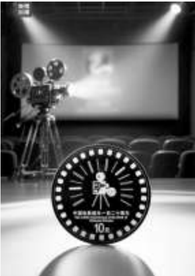
纪念中国电影诞生120周年纪念邮品、金银纪念币正式推出