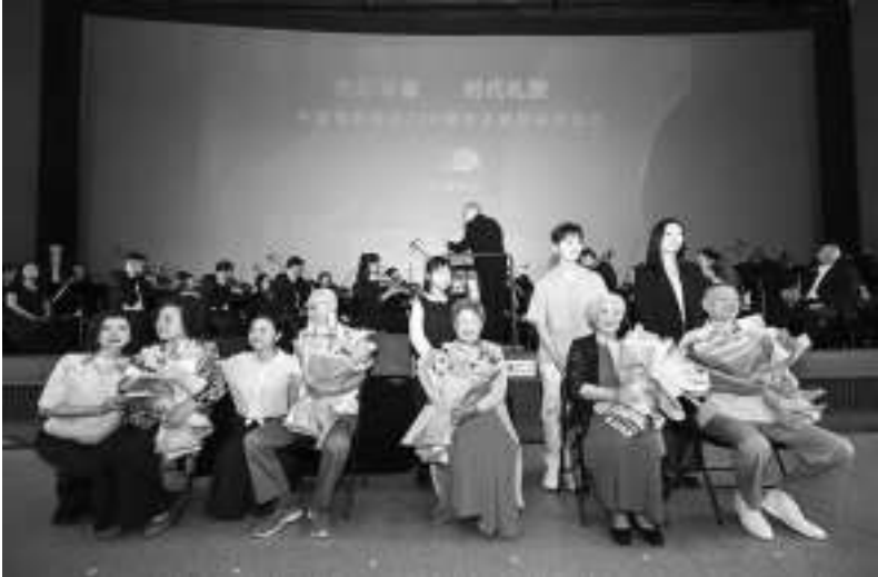
“光影华章 时代礼赞”中国电影诞生120周年主题展映启动仪式