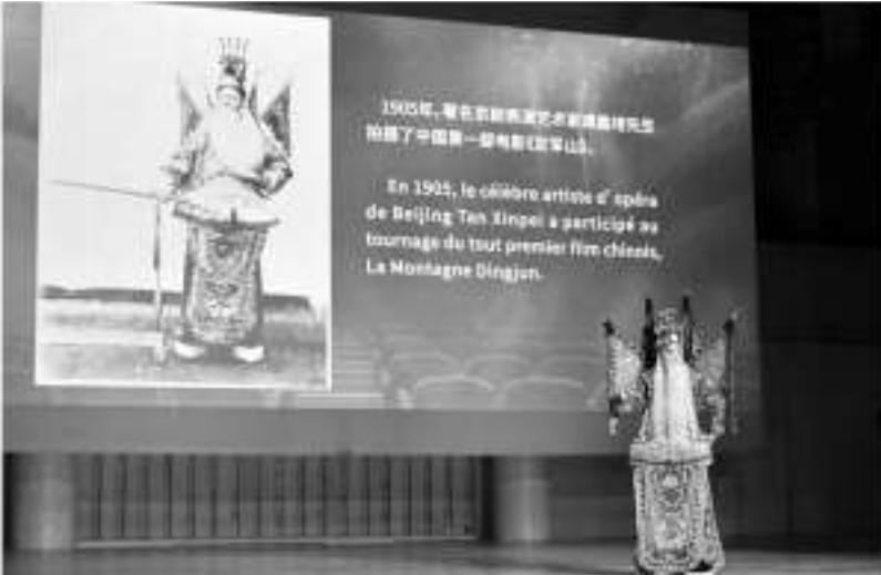
经典电影《定军山》亮相“光影百年·中法同行”电影音乐会