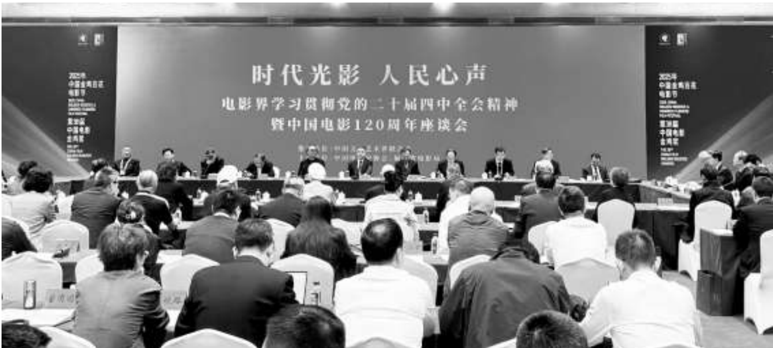
2025年11月,“时代光影人民心声——电影界学习贯彻党的二十届四中全会精神暨中国电影120周年座谈会”在厦门金鸡百花电影节期间召开

2025年,恰逢世界电影诞生130周年、中国电影诞生120周年的重要节点。从1905年《定军山》以黑白影像点亮民族光影之路,到如今银幕上百花齐放的时代图景,中国电影历经一个多世纪的风雨兼程,早已成为记录民族命运、传递人民心声、彰显文化自信的重要载体。为纪念这一历史性时刻,全国各地、各级影视机构、行业协会及相关单位携手联动,以展览、论坛、放映、IP发布等多元形式,推出了一系列内容丰富、意义深远的纪念活动。这些活动既回溯了中国电影120年的光辉历程,又聚焦新时代的发展成就,更凝聚起迈向电影强国的磅礴力量,在全国范围内掀起了致敬光影、热爱电影的文化热潮。