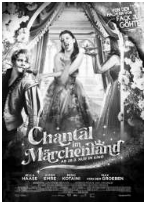
德国票房前十名(1月1日至10月6日)