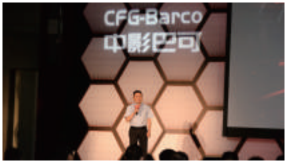
重庆电影处处长 何洪元先生