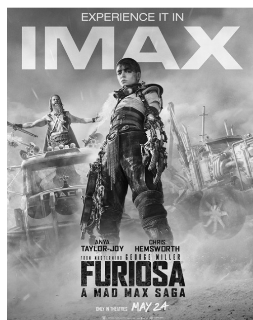
《疯狂的麦克斯:狂暴女神》