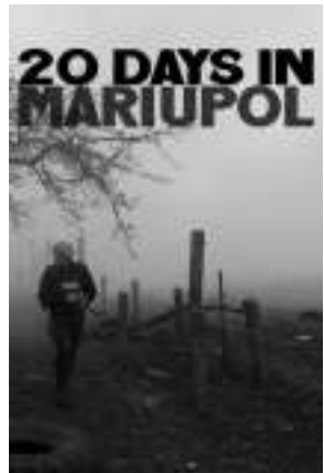
《在马里乌波尔的20天》