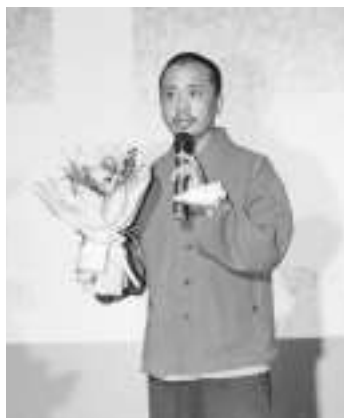
乔美在影片首映现场和观众交流