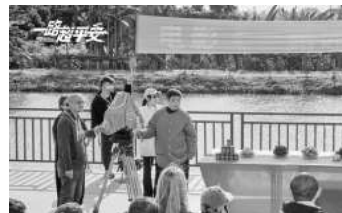
《一路超平安》开机仪式现场

该片导演兼编剧孙小杭近年参与编剧的多部电影均获得了不错的票房成绩,2014年《心花路放》以11.7亿票房成绩成为当年华语片票房冠军,2019年由宁浩执导,黄渤、沈腾主演电影《疯狂的外星人》总票房突破22亿。(花花)