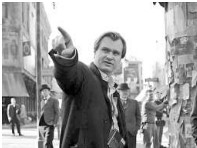
《信条》部分拍摄于印度孟买