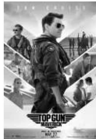
已达770万美元;意大利当地累计票房已达1090万美元;荷兰当地累计

上周末,派拉蒙公司发行的《壮志凌云2》在其上映的第五周重回国际周末票房榜的榜首,新增周末国际票房4450万美元,其国际累计票房已达4亿8470万美元,全球累计票房10亿600万美元,超过了《奇异博士2》(9亿4990万美元)成为2022年全球票房最高的影片。影片上周末在韩国首映,收获票房1290万美元。从累计票房方面看,影片在英国/爱尔兰的成绩最好,当地累计票房已达7870万美元;其后是日本的5110万美元;澳大利亚当地累计票房已达4550万美元;法国当地累计票房已达3880万美元;德国当地累计票房已达2340万美元;丹麦当地累计票房已达890万美元;西班牙当地累计票