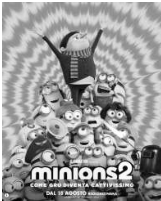
《小黄人大眼萌:神偷奶爸前传》