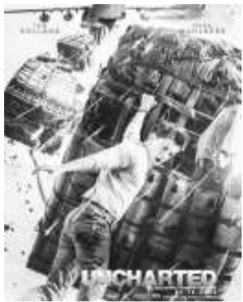
这个冬天是属于汤姆·霍兰德的,在他主演的《蜘蛛侠:英雄无归》上映仅

仅十天后,这位25岁的英国演员主演的、改编自电子游戏的《神秘海域》又登上了北美周末票房榜单的冠军宝座,该片的首周末三天票房为4416万美元。上周末是美国的总统日小长假,周一后的四天票房为5100万美元。影片上周末在北美的4275家影院上映,平均单厅票房收入为11929美元。