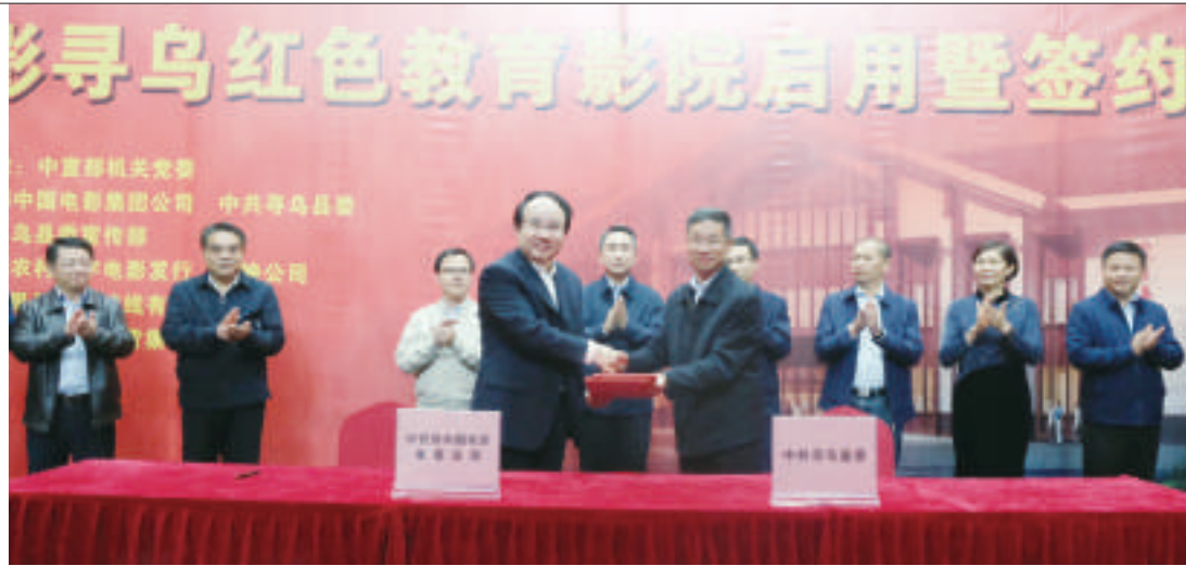
中影寻乌红色教育影院签约