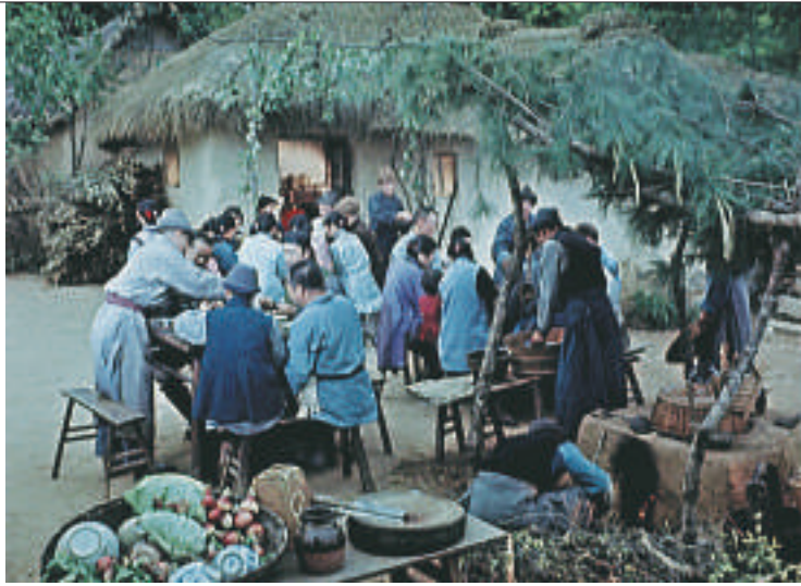
“贺老六婚宴喝酒”修复后照片