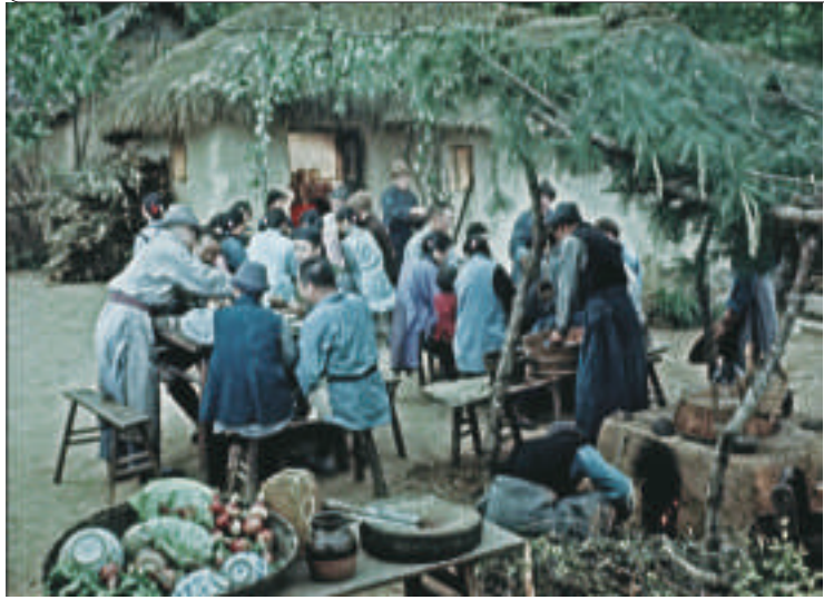
“贺老六婚宴喝酒”原照片