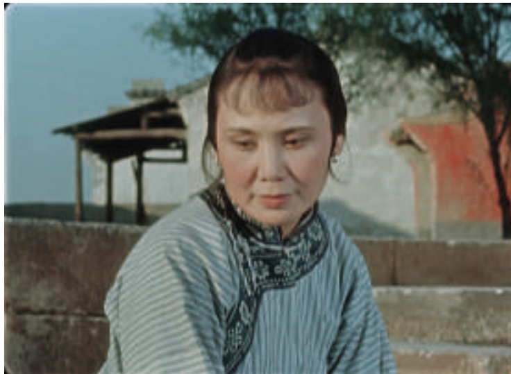
祥林嫂修复后照片