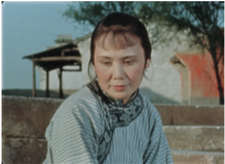
祥林嫂在影片中的原照片