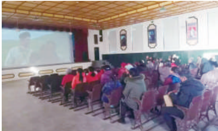
“电影周边工程”建成边境沿线蒙古语公益电影放映室