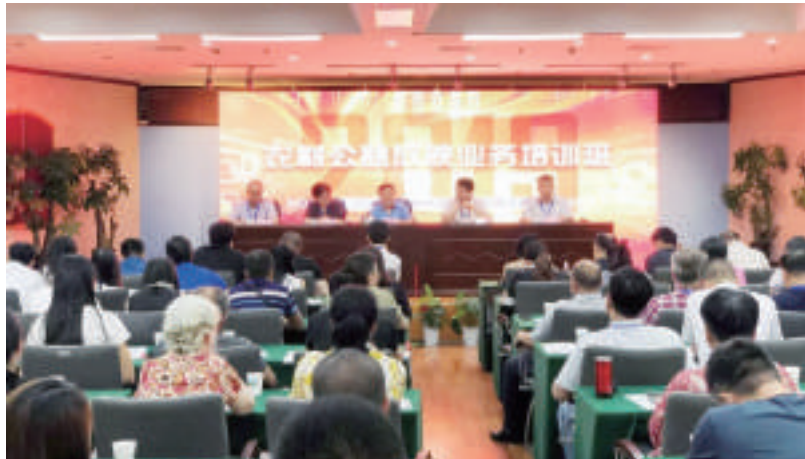
农村公益放映业务培训班在湖北宜昌举办