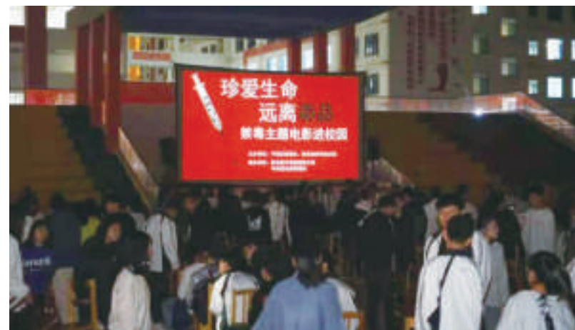
禁毒主题电影进校园放映