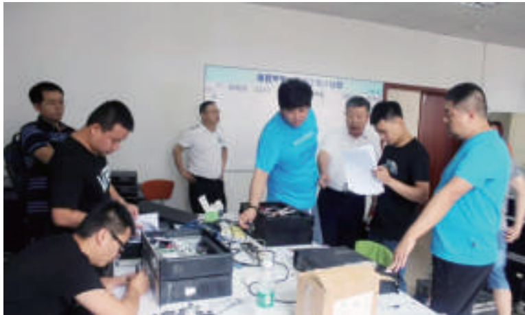
电影数字节目管理中心赴乐山开展数字放映器时钟校验工作

回传等基本功能,提供用户行为数据智能分析服务,以实现有效供片与有效需求的直接对接。其次是构建“互联网+卫星”的农村电影传输平台,打造优势互补、双向并行的安全传输模式。同时构建“互联网+监管”的农村电影数据监管平台,确保数据采集覆盖全国,场次统计准确有效,监管功能可查可控。 (本文由电影数字节目管理中心供稿)