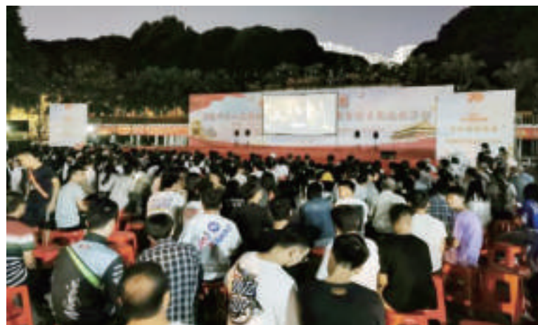
《红星照耀中国》农村首映暨“我和我的祖国”庆祝中华人民共和国成立70周年公益电影主题放映活动在广西百色举办