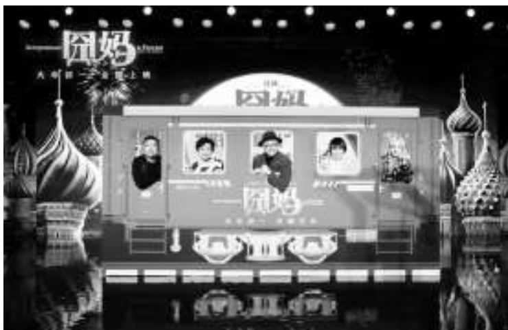
徐峥(中)率主创亮相发布会

本报讯 12月21日,徐峥“囧系列”最新电影《囧妈》举行“旅行的意义”发布会,导演兼领衔主演徐峥,领衔主演黄梅莹,特约主演袁泉,主演贾冰等悉数亮相。众主创围绕囧途旅程,分享了电影幕后拍摄趣事。