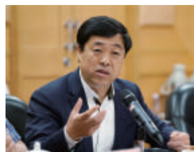
刘建中(原国家广电总局电影局局长、中国电影博物馆筹建组组长)