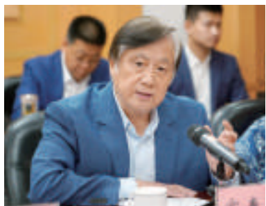
窦春起(中影集团原党委书记、中国儿童电影制片厂厂长)