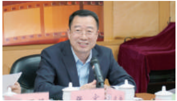
中国电影家协会分党组书记、驻会副主席张宏致辞