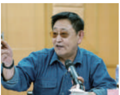
郭凯敏(著名影视演员、德艺双馨文艺工作者)