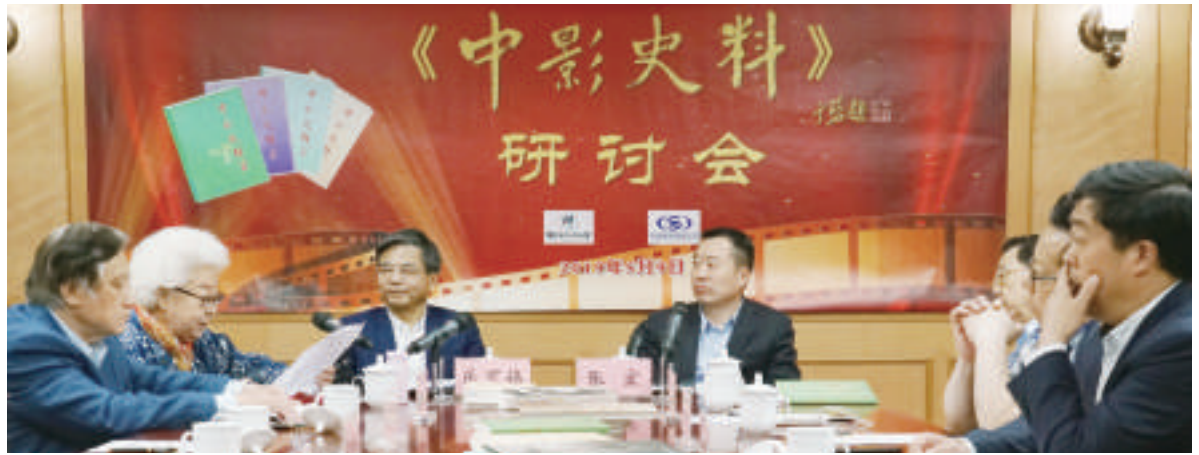
著名艺术家田华等代表们踊跃发言