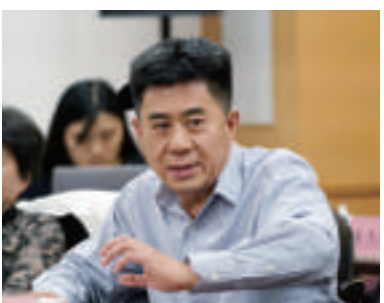
郭凯敏(著名影视演员、德艺双馨文艺工作者)