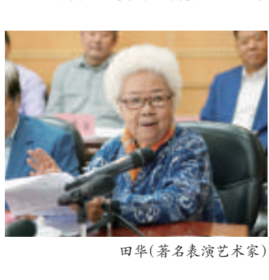
田华(著名表演艺术家)

田华(著名表演艺术家):《中影史料》给了我一次重温电影历史的机会,给了我一个学习的平台