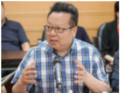
霍廷霄(中国电影美术学会会长)