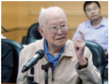
章柏青(中国电影评论学会名誉会长)