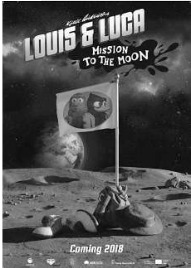
《索兰与路德维格:月球使命》

随着挪威各种各样的电影和电视剧走向海外,当地的创造性行业蓬勃发展。但制片公司表示需要更多的政府支持。